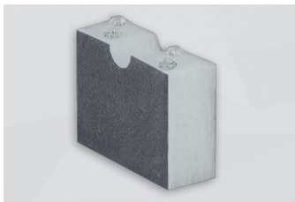
F700 FR HO/53