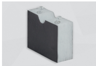
F700 FR HO HT